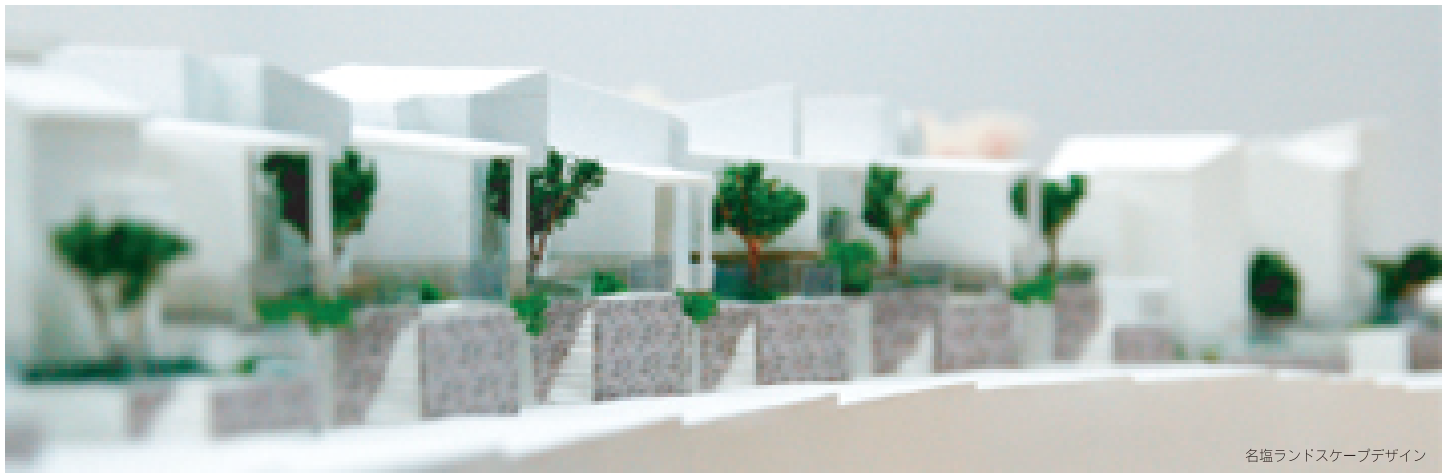
名塩ランドスケープデザイン