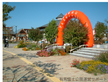
有馬富士公園運営サポート