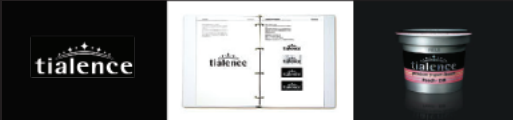
明治乳業株式会社

1952年大阪出身、武蔵野美術大学卒業。 1985年ブランディングを専門とする事務所を設立、数多くの新ブランドの創設を手がけた。また欧米企業・ブランドと日本企業の提携に関わるブランディング、および海外建築家、アーティストとのコラボレーションでも多くの実績がある。武蔵野美術大学講師、日本ディスプレイデザイン協会副会長。 http://www.kdi-inc.jp