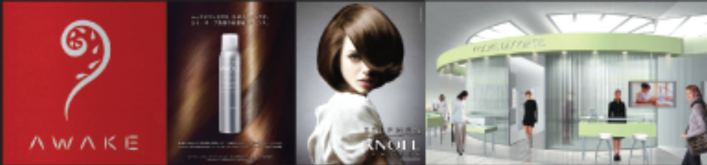
株式会社コーセー